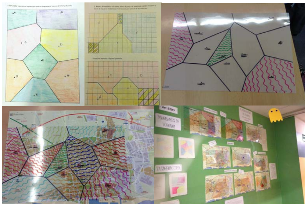
Figura 4. a) Diagrama de Voronoi, de Diana Vikhrov. b) Taxigeometria, de Jan Romagosa. c) Diagrama de Voronoi en construcció, de Santi Roldán i Aina Amate. d) Diagrama de Voronoi sobre mapa. e) Exposició de tots els maps.

També volem afegir que, sobretot amb les matemàtiques, és el matemàtic el que coneix el procés cognitiu de l'estudiant (Watson i Barton, 2011): com el cervell d'un adolescent fa el pas a l'abstracció. Moltes vegades els processos abstractes (com les equacions o les sumes de fraccions) s'ensenyen com a purs algorismes rígids i no hi ha una preocupació en com un adolescent percep aquests processos.