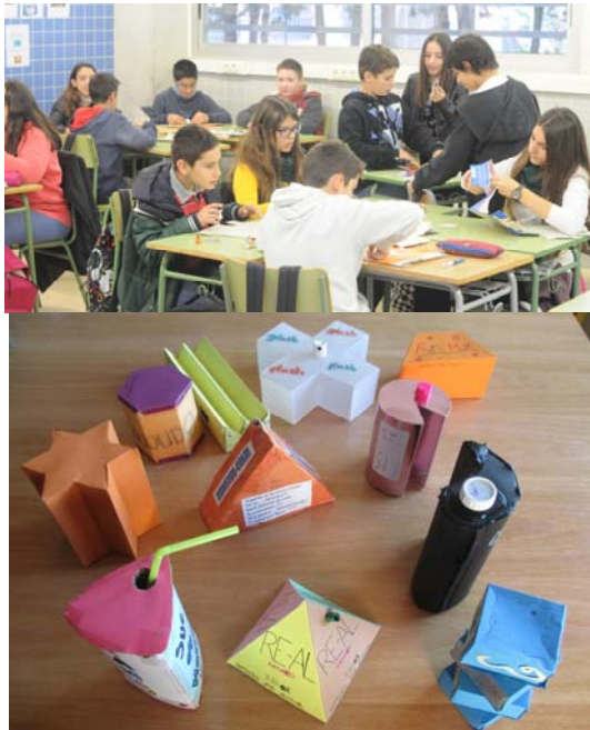
Figura 1. a) Alumnat de l'Institut A.M. Raspall creant els seus envasos. b) Envasos creats per alumnat de l'Institut Sui de Cardedeu.

El professorat analitza els procediments emprats per cada estudiant i els hi fa modificar, si cal, per tal de millorar tant el seu aprenentatge com els resultats finals. L'elaboració de l'informe és una eina de control per part del professorat de la feina que s'està fent i permet la millora progressiva. Es valora el producte final i el procediment emprat per arribar-hi sempre de manera proporcional a les capacitats de cada alumne. Aquesta valoració s'utilitza per recolzar l'aprenentatge