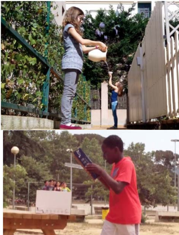
Figura 3. a) Thales assedegat. b) Curtmetratge del curs 2014-15 a l'INS Arquitecte Manuel Raspall.

ne, però, realitza un informe individual de tot el procés de la creació del curt seguint la guia de treball i essent partícip del seu aprenentatge (Freudenthal, 1973). D'aquesta manera, l'avaluació està integrada en el procés d'aprenentatge, de manera que en l'elaboració de l'informe l'alumne reflexiona sobre el seu procés creatiu per tal d'incidir en la millora contínua de l'activitat. En aquesta activitat, l'essència de l'avaluació consisteix en la reflexió mútua alumne-professor, en «com es pot millorar en qualsevol aspecte», des de la capacitat de verbalitzar els raonaments fins la consecució final de la pel·lícula. Si aconseguim que l'alumne faci una veritable reflexió de millora haurem aconseguit l'èxit en l'avaluació. Finalment, tots els grups fan la presentació del seu producte final, el curtmetratge, presentant també l'escena del truc de cinema i la resta de grups comproven, mitjançant el Teorema de Thales, l'eficiència dels efectes especials o trucs de cinema. Degut a que el context és proper a l'alumnat (ells són els creadors de l'objecte que estudien) s'incrementa la motivació en treballar amb les creacions pròpies i les dels companys. Finalment, el treball del professorat és converteix en «validar» les propostes creatives de l'alumnat afrontant situacions i solucions inesperades enlloc de «donar la solució única». En aquest nou rol del professorat les noves tecnologies tenen un paper fonamental.