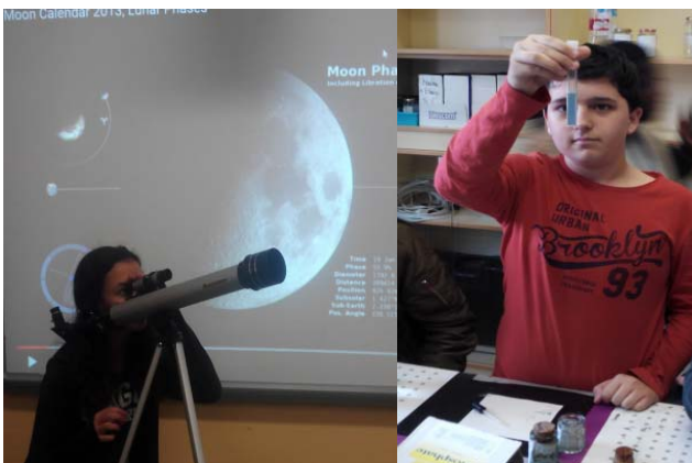
Figura 1. L'ABP és un espai candidat per al desplegament de la proposta STEM. Imatges d'alumnes en diferents activitats STEM a l'Institut Marta Estrada, de Granollers.

Des de l'àrea de Matemàtiques, 8 ponències (Planella et al. , 2017, Margelí et al. , 2017) posen en evidència que l'espai, la forma, la creativitat, les conjetures, i la planificació ubiquen les matemàtiques en un context didàctic que trenca les barreres que les limitaven a una matèria instrumental, donant veu al seu discurs.