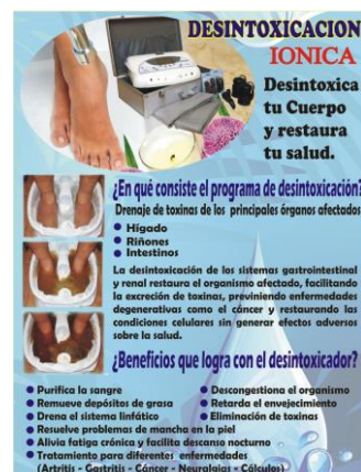
Figura 3. Anunci sobre la desintoxicació iònica i els seus beneficis.

Una de les proves que fan per a "evidenciar" la gran quantitat de brutícia que hi ha a l'aigua de l'aixeta consisteix en fer un reacció electrolítica semblant a la que té lloc en la desintoxicació iònica.