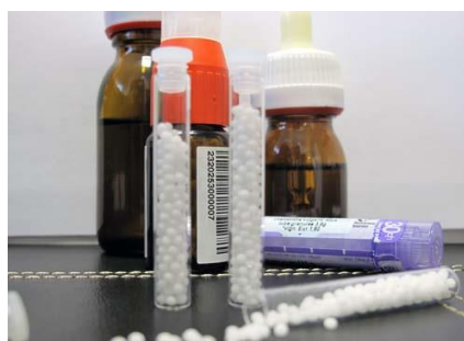
Figura 2. Imatge d'uns medicaments homeopàtics en forma de boles de sacarosa

discussió és: "L'homeopatia funciona?". En cas afirmatiu, com ho fa? En cas negatiu, per què tanta gent la pren i es ven a les farmàcies?